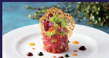
C Plan <コース料理>