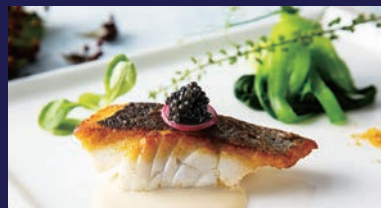
B Plan <コース料理>