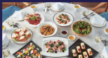
D Plan <テーブルビュッフェ>