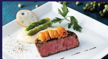
A Plan <コース料理>