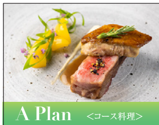
A Plan <コース料理>